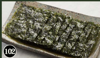
102 韓国海苔 ¥380 (税込¥418) Korean Seaweed