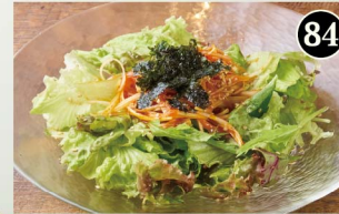
84 旨辛ねぎサラダ Spicy Green Onion Salad ¥680 (税込¥748)