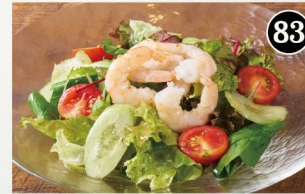
83 ふりふりエビの サラダ Juicy shrimp salad ¥780 (税込¥858)