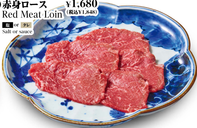
44 赤身ロース ¥1,680 Red Meat Loin (税込¥1,848) 塩 or タレ Salt or sauce