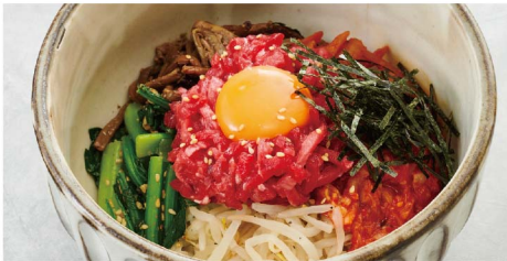
54 炙りユッケビビンバ Bibimbap-Rice with Broiled Wagyu Tartare ¥1,780 (税込¥1,958)