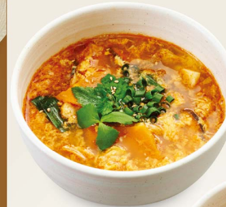
121 極カルビ スープ Kalbi soup ¥980 (税込¥1,078)