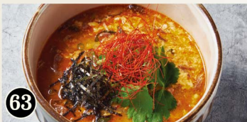
63 極ユッケジャンクッパ Yukgaejang Gukbap ¥1,180 (税込¥1,298)