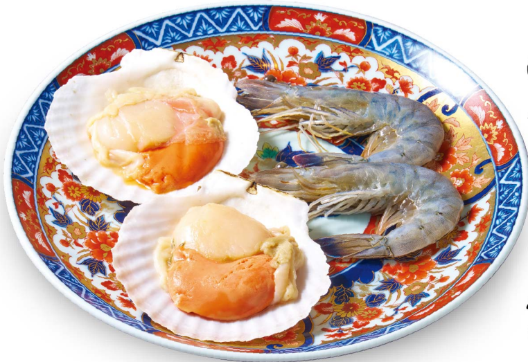
④9 海鮮盛り合わせ 天使の海老 殻付きホタテ Assorted Seafood (Angel Shrimp, Shelled Scallop) ¥2,480 (税込¥2,728)