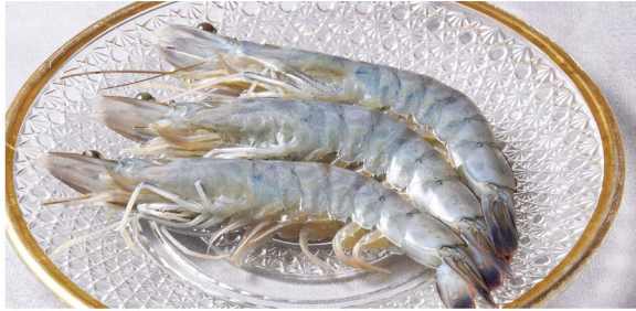
④7 天使の海老塩焼き ③尾 ¥1,880 (税込¥2,068) Salt-Grilled Angel Shrimp