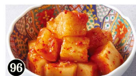
96 大根のキムチ Radish Kimchi ¥490 (税込¥539)