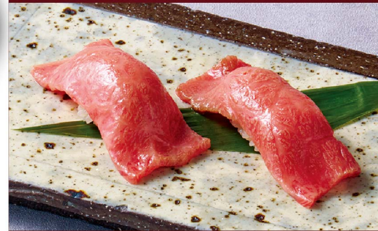
和牛の炙り肉寿司 Broiled Wagyu Beef Sushi