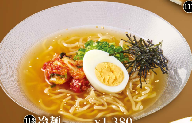
113 冷麺 ¥1,380 Cold Noodle (税込¥1,518)