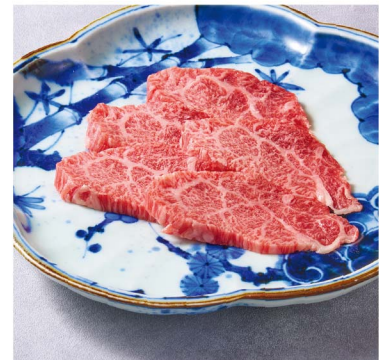
41 カルビ ¥1,580 Short Rib (税込¥1,738) 塩 or タレ Salt or sauce