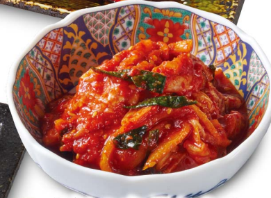
93 本気の白菜キムチ Serious Chinese Cabbage Kimchi ¥580 (税込¥638)