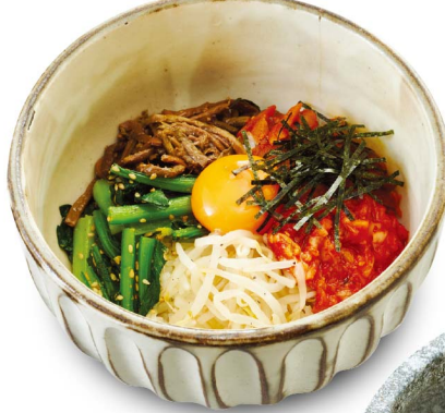
51 ビビンバ Bibimbap-Rice ¥1,100 (税込¥1,210)