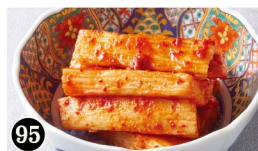
95 長芋のキムチ Yam Kimchi ¥490 (税込¥539)