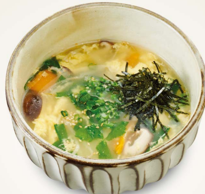
61 玉子野菜クッパ Egg and Vegetable Rice Soup ¥780 (税込¥858)