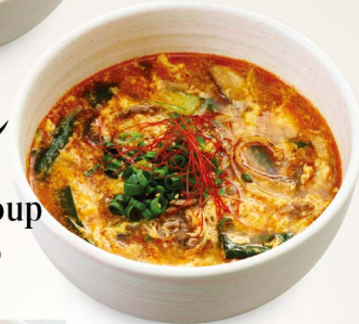
123 玉子スープ Egg Soup ¥580 (税込¥638)