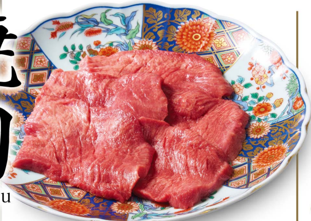
37 タン塩 ¥2,280 Tongue (税込¥2,508)