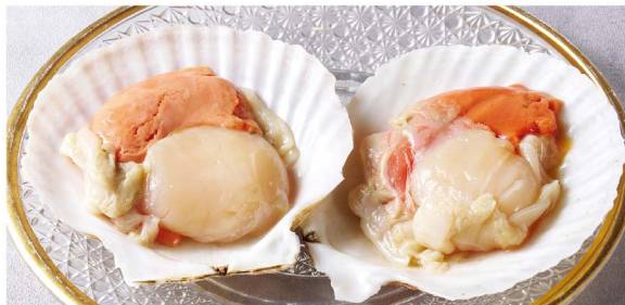
④8 ホタテ焼き ¥1,280 (税込¥1,408) Grilled Scallops