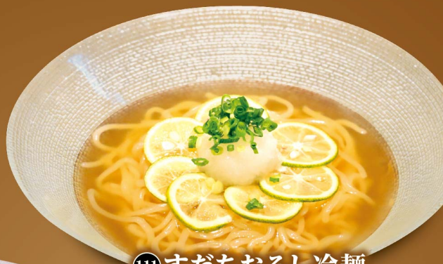
111 すだちおろし冷麺 Sudachi Cold Noodles ¥1,380 (税込¥1,518)