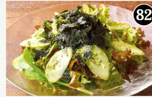
82 チョレギサラダ Choregi Salad (Green Salad with Salty Dressing) ¥780 (税込¥858)