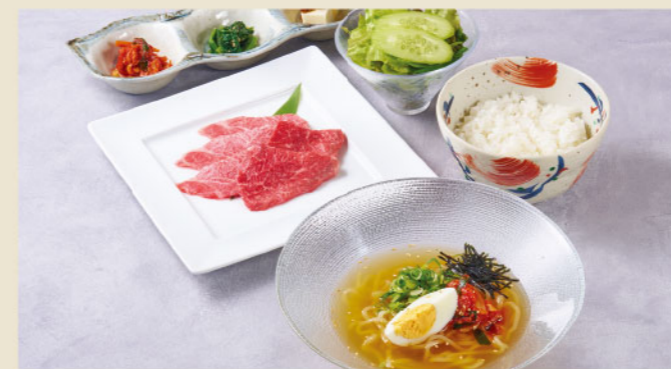
冷麺と焼肉御膳(5枚)セット Cold Noodles and Grilled Meat Set (5pcs) ¥1,880 (税込¥2,068)