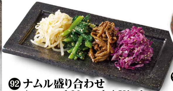
92 ナムル盛り合わせ Assorted Namul 4 Kinds 季節により異なります。 ¥690 (税込¥759)