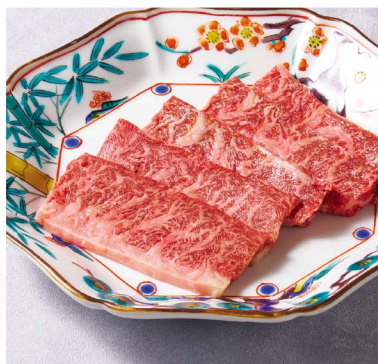
42 ハラミ ¥2,580 Skirt Steak (税込¥2,838) 塩 or タレ Salt or sauce