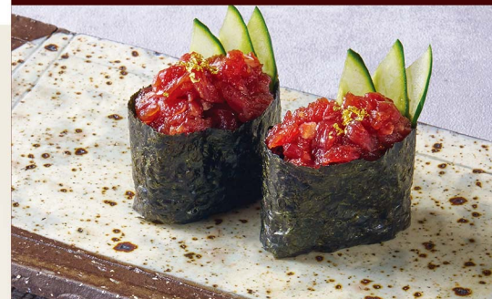
ユッケ軍艦 Yukhoe Gunkan