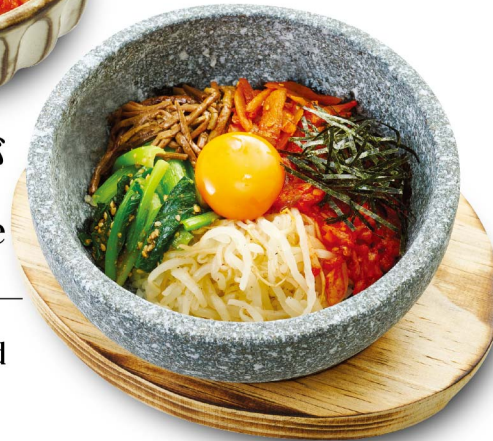
53 ミニ石焼きビビンバ Mini-Stone Roasted Bibimbap rice ¥880 (税込¥968)