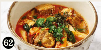
62 極カルビクッパ Galbi Gukbap ¥1,180 (税込¥1,298)