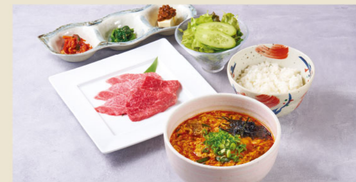
カルビ麺と焼肉御膳(5枚)セット Kalbi Noodles and Grilled Meat Set (5pcs) ¥1,880 (税込¥2,068)