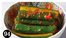
94 きゅうりのキムチ Cucumber Kimchi ¥490 (税込¥539)