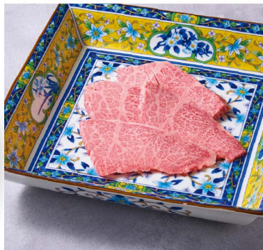
40 上カルビ ¥2,680 Best of Short Rib 塩 or タレ Salt or sauce (税込¥2,948)