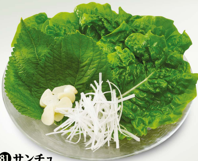
Salad 81 サンチュ Wrapped Vegetable ¥780 (税込¥858)