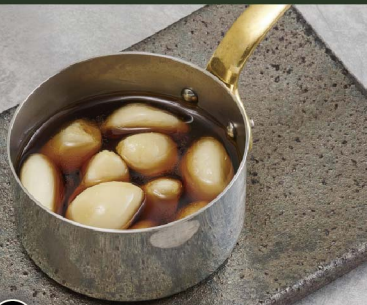
101 ニンニク焼き Grill Garlic ¥480 (税込¥528)